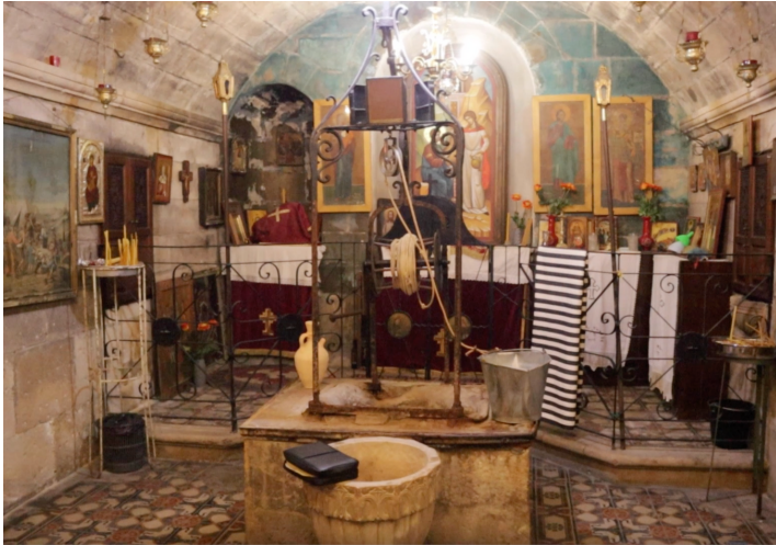
POZO DE JACOB

“TODO EL QUE BEBA DE ESTA AGUA, VOLVERÁ A TENER SED; PERO EL QUE BEBA DEL AGUA QUE YO LE DÉ, NO TENDRÁ SED JAMÁS” (JUAN 4, 13).