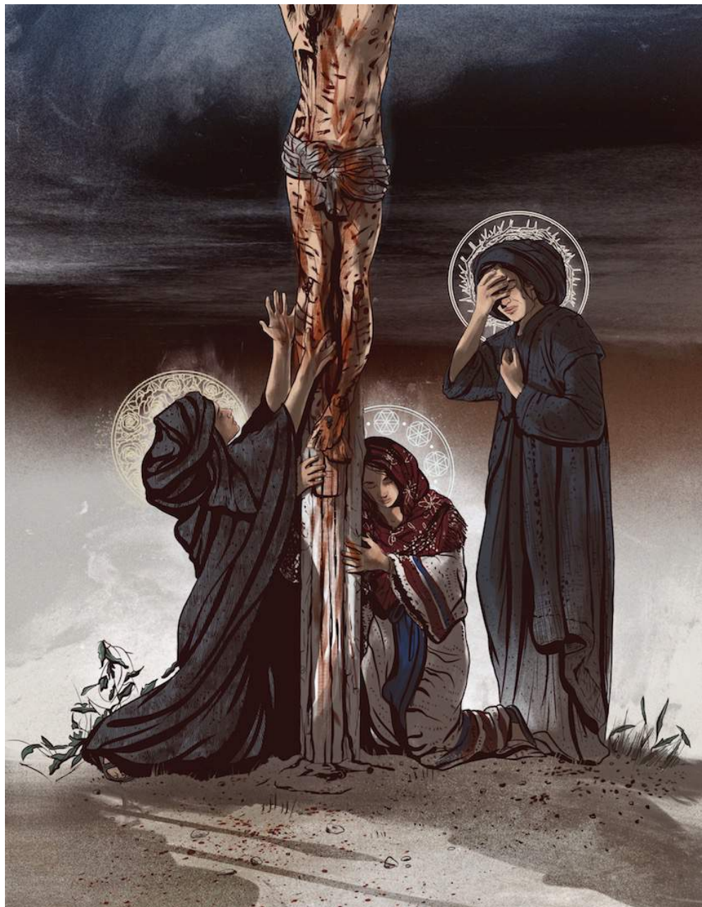
Ilustración por Danielle Storey