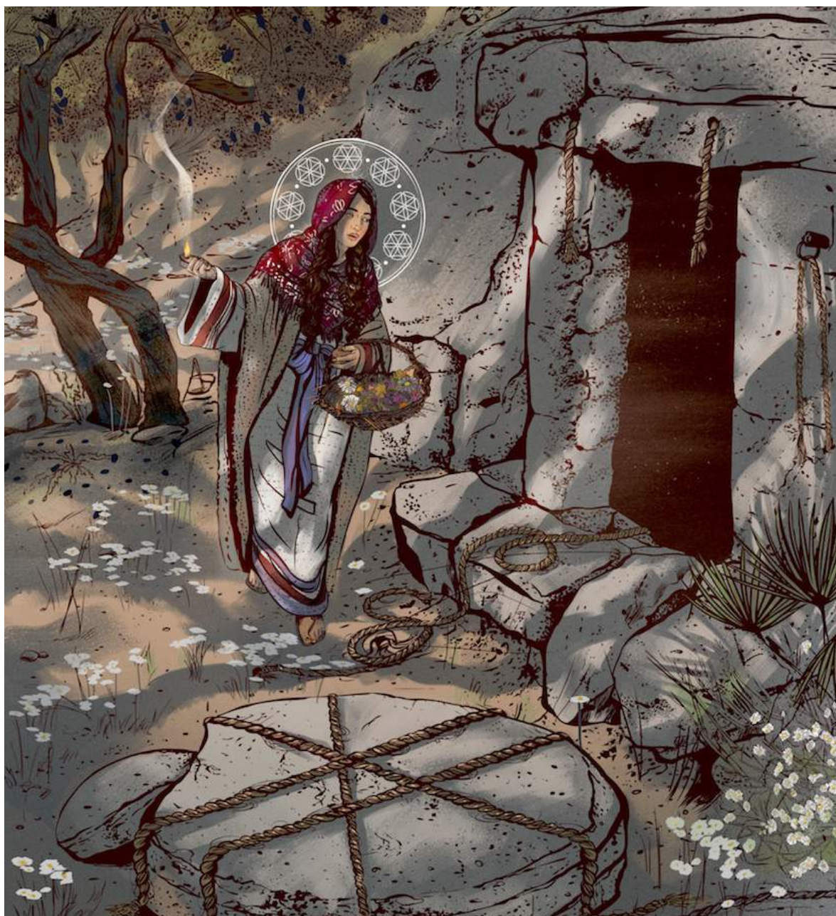
Ilustración por Danielle Storey