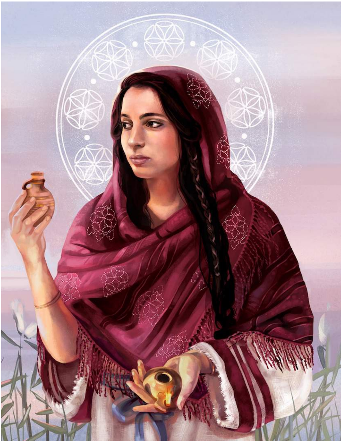
Ilustración por Danielle Storey